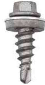
schroef gemonteerd met dichtingsring

reparatieschroef op staalplaat - met gereduceerde boorpunt