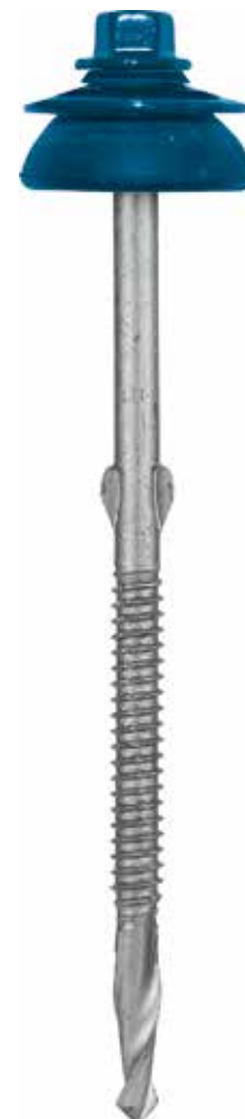
blanke schroef gemonteerd met dichtingsring